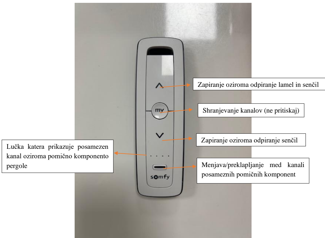
Slika 1: Pomen gumbov na daljinskem upravljalniku

Daljinski upravljalnik je preprost ter poenostavljen za uporabo, saj ima samo štiri stikala oziroma gumbе. Njihov pomen oziroma funkcija je predstavljena na spodnji fotografiji.